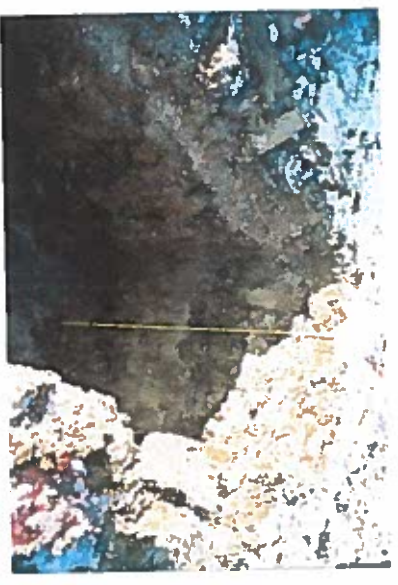
Vue du profil lithologique de la fosse F2