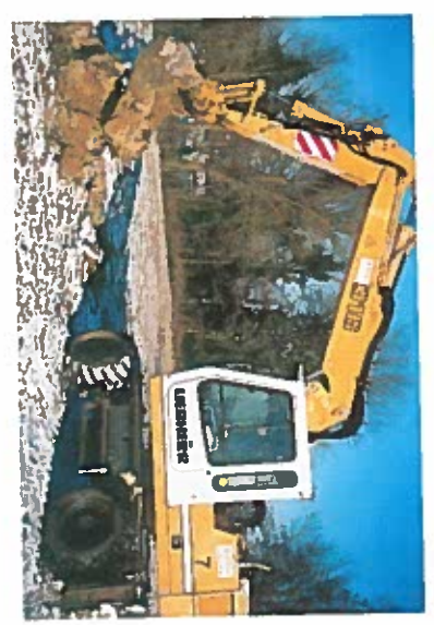
Ouverture à la pelle mécanique de la fosse F2