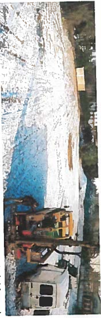
Pose du piézomètre PZ1 en limite ouest du site & vue du piézomètre achevé (avec bouche à clef orange)