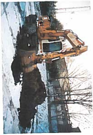
Ouverture à la pelle mécanique de la fosse F1 & vue du profil lithologique de la fosse F1